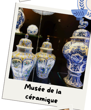
Musée de la céramique