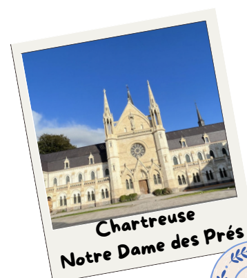
Chartreuse Notre Dame des Prés