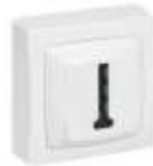
Prise téléphonique actuelle

Afin d'anticiper la disparition totale de votre ancienne ligne téléphonique, nous vous recommandons d'effectuer le raccordement de votre logement à la fibre au plus vite . Cette démarche, aujourd'hui prise en charge , vous permettra d'assurer la continuité de vos services actuels : n'attendez pas la dernière minute au risque d'être facturé.