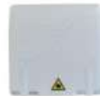
Prise fibre à installer

Le raccordement de votre logement à la fibre se traduit par l'installation d'une nouvelle prise murale à l'emplacement de votre choix . Pour bénéficier de votre installation il vous suffit de contacter l'opérateur de votre choix (liste au dos du document).