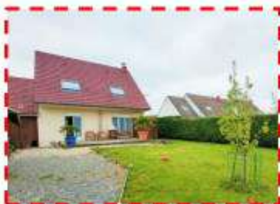
Rue de Rénoval Vendu à -2 % du prix

dans le cadre d'un mandat exclusif 3mois