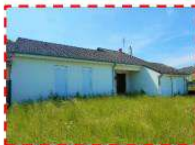
Rue de Rénoval Vendu au prix !