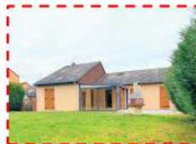
Allée de Mantoux Vendu au prix !