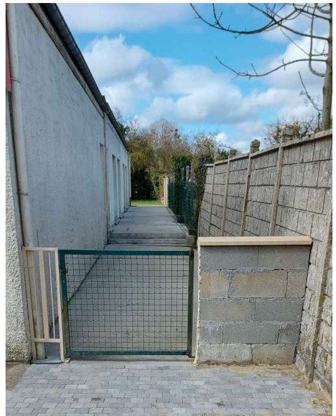
Aménagements réalisés par les services techniques à l'école maternelle