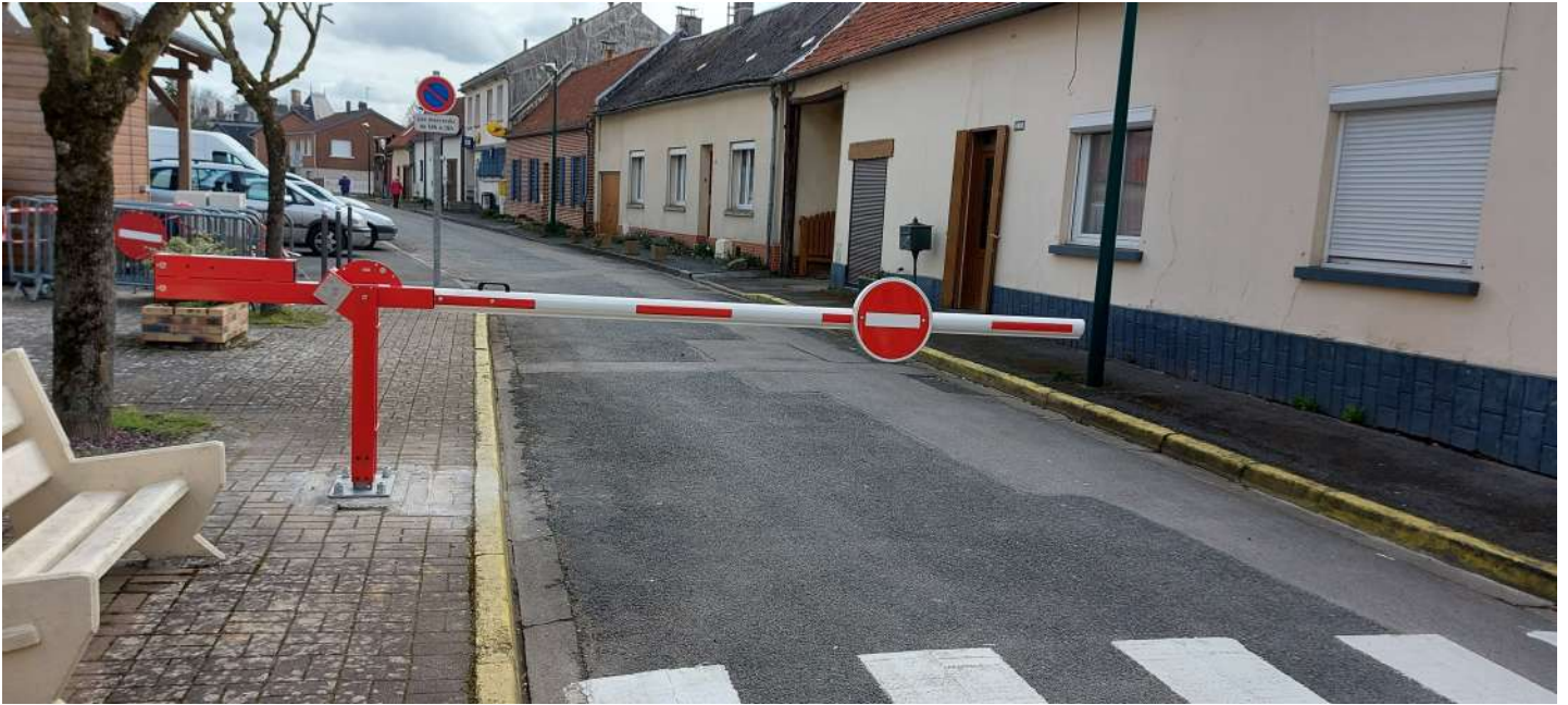
Implantation d'une barrière pour sécuriser la place du marché