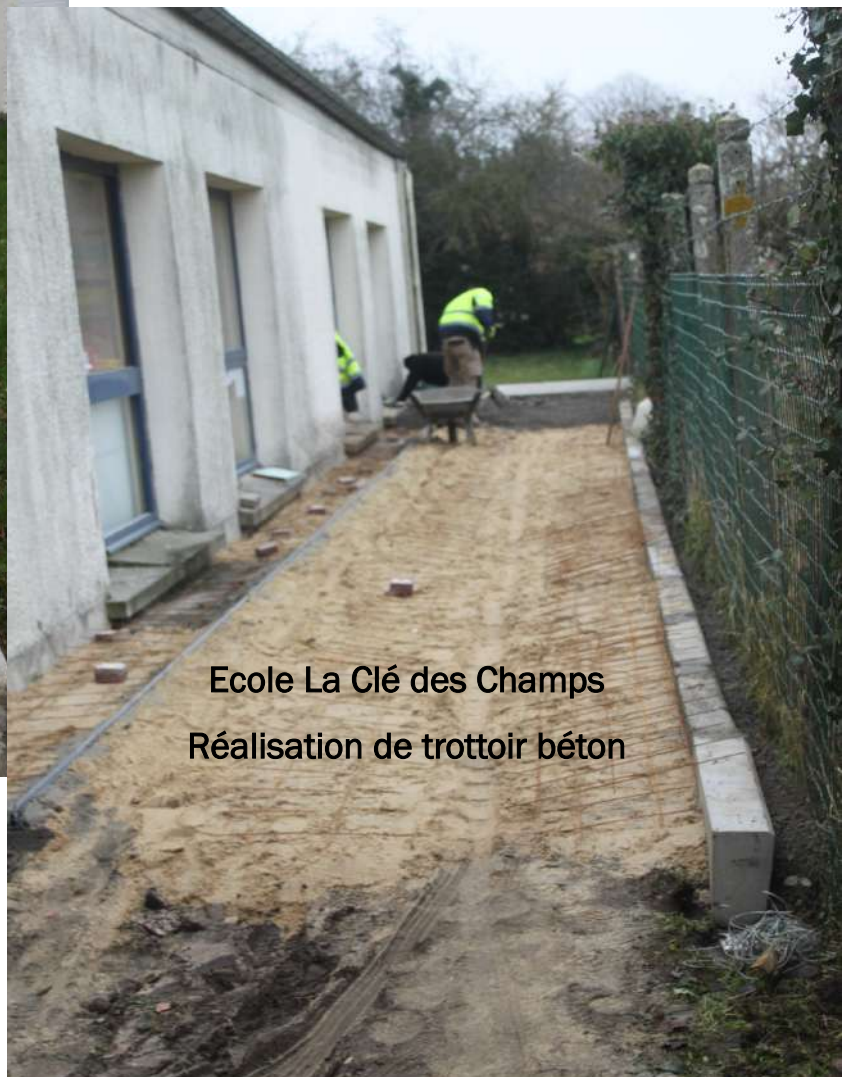
Ecole La Clé des Champs Réalisation de trottoir béton